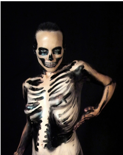
Saksia Edens (*1975) Make-up, 2008 Video, 18 min. 11 sec.; Sound: Daniel Buess