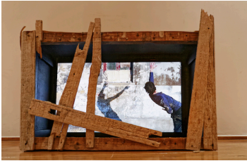
Eva Borner (*1967) Dingzihù II, 2014 Videoskulptur Atelieransicht Shanghai 2014 © Eva Borner