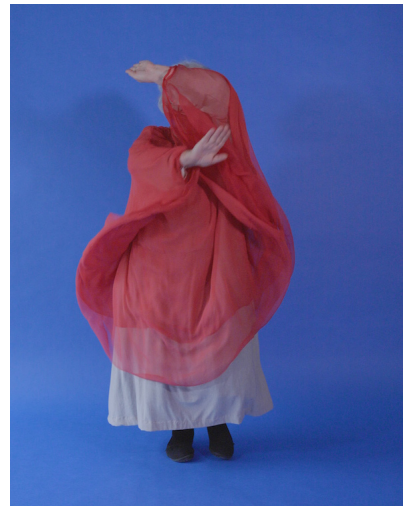
Till Velten (*1961) Arbeit mit Josefine, 2022 Videostill © Künstler