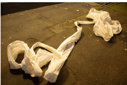
Regina Graber & Sivlie Xing Chen Cocooning, 2020 Performance; Foto: Live-Performance, Tanzfragmente Olten, 2020