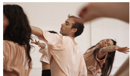
Lysann König (*1986) Becoming LYSANN, 2021 Videostill aus 2-Kanal Videoprojektion mit Sound, 48'22" © Künstlerin