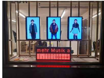
Rachel Bühlmann, Sadyho Niederberger, Lea Pelosi what / do you see / me?, 2022 Ausstellungsansicht Kunst im Eck, Aarau, 2022